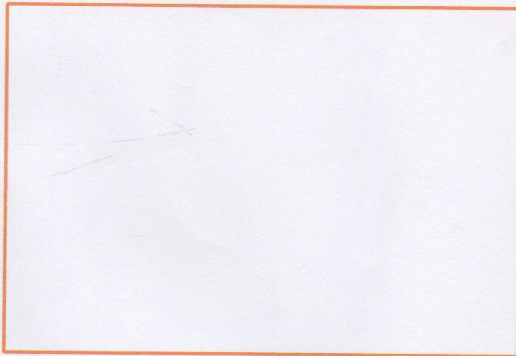
Figura de fierro

La Suscrita Directora Municipal de Justicia de este término en uso de las facultades legales que la ley le confiere: concede permiso al Señor (a) _____ con número de identidad _____ vecina de la comunidad de _____ de este municipio para que pueda elaborar su fierro de herrar por no haber otro igual o parecido se le extiende la presente a los _____ del mes de _____ del Año 201 _____.