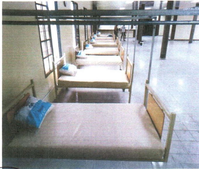
Instalación de 10 Camas Unipersonales tipo Hospitalarias en el Triage Municipal

Correo. municipalidadamapala@yahoo.com Tel. 27958524 – 27958258