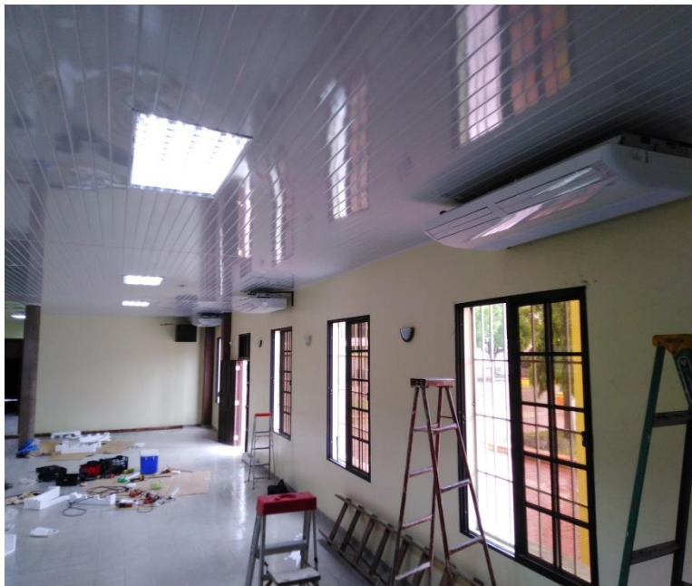
Instalación de Tres Aires acondicionados en el Triaje Municipal