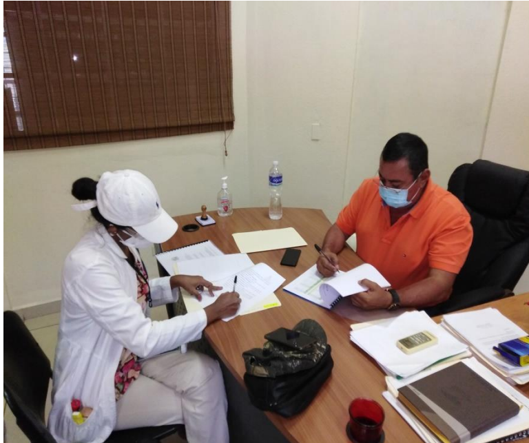
Firma del Convenio Cooperación entre la Municipalidad y la Coordinadora ECOR de Salud.