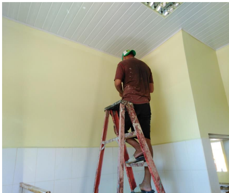
Actividades de Pintura en las instalaciones donde funcionara el Triage Municipal