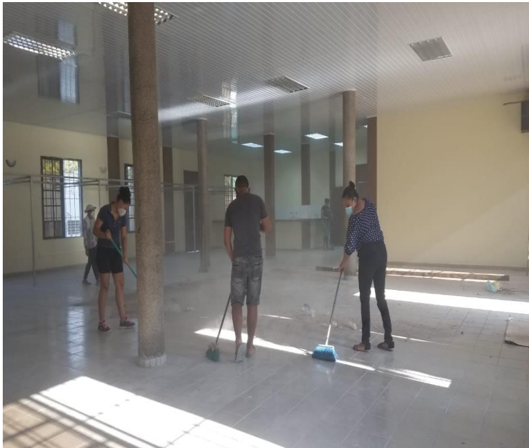
Actividades de Limpieza en Instalaciones del Triaje Municipal