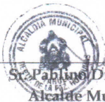
St. Pablino Díaz Orellana Alcalde Municipal

En fe de lo cual firmamos el presente convenio en dos (2) ejemplares originales de igual valor para cada una de "Las partes", Dado en el Municipio de Yarula La Paz a los 22 días del mes de Julio del año dos mil veinte (2020)