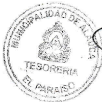
Esaú Castellano Espinoza