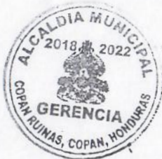
Alcalde Municipal o Gerente Administrativo