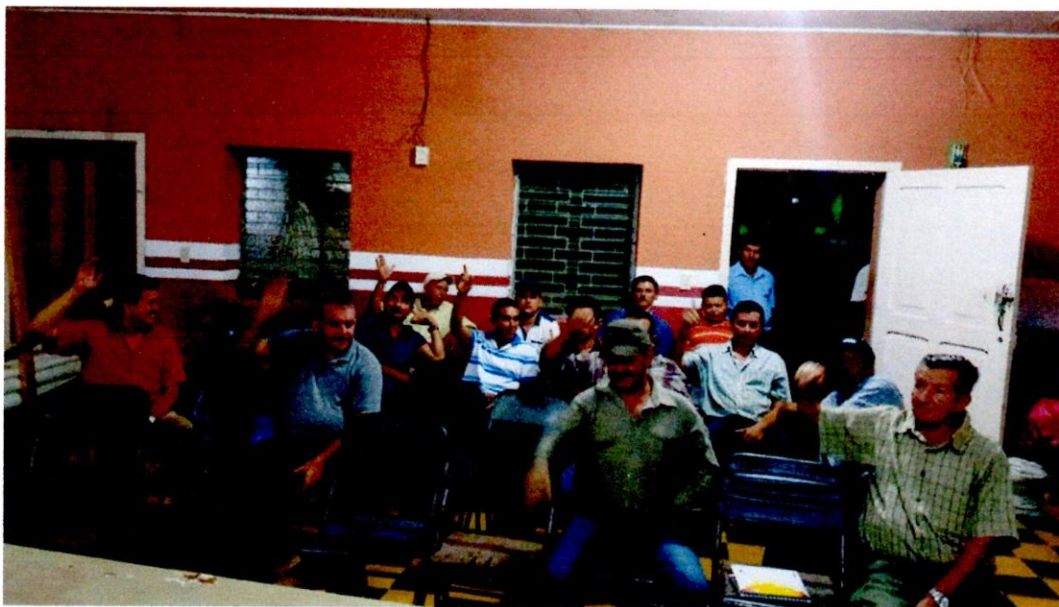
ASAMBLEA COMUNIDAD DE LA UNION, TRINIDAD, SANTA BARBARA