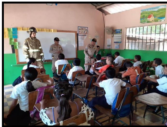
MESA DE TRABAJO EN LA ESCUELA ROBERTO MEJIA DE BARRIO LA GRANJA