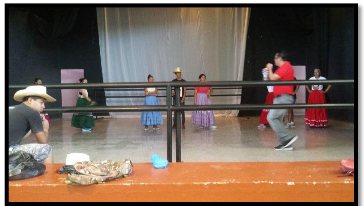
CUADRO DE DANZAS FOLKLORICAS DE LA COMUNIDAD DE SANTIAGO DE PURINGLA.