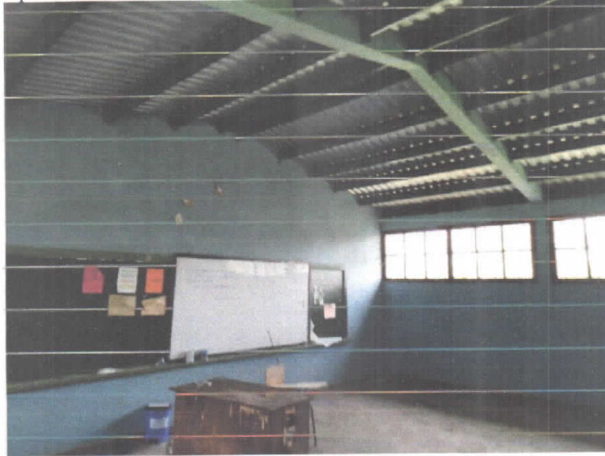
Reparación de techo en mal estado de colegio. Pintado de paredes de tres aulas