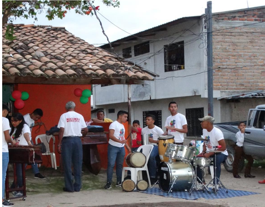
Presentación Grupo Artístico El Torreón en Yarumela.