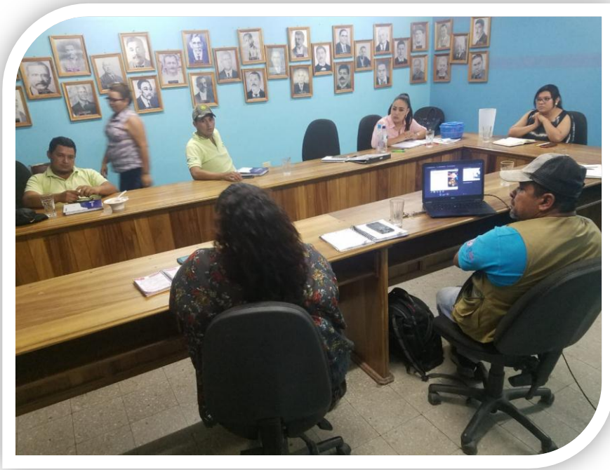
Reunión con USAID