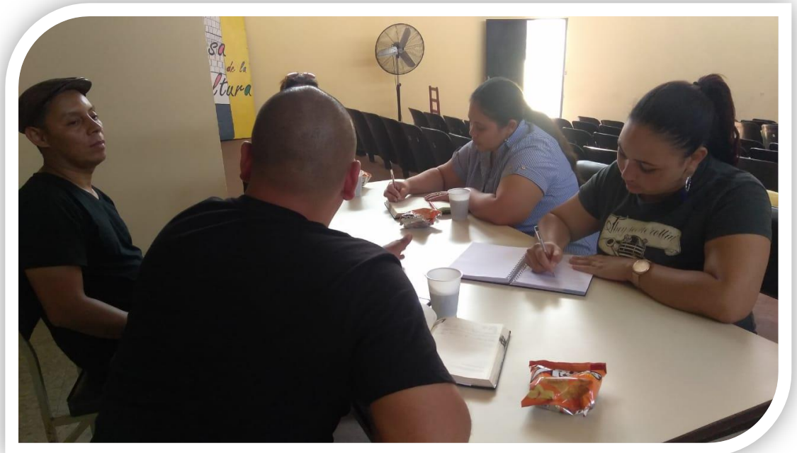
Reuni ón de trabaj o con la junta directi va