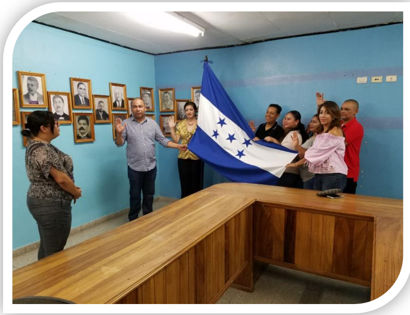
Juramentación del comité turístico