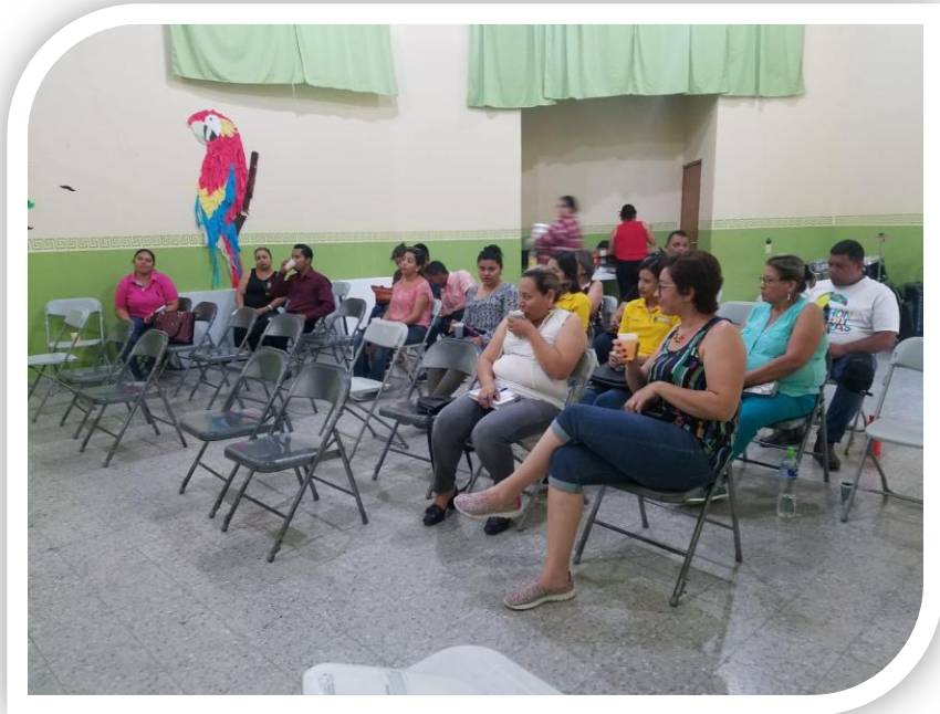
Reunión para elegir el nuevo comité de turismo paceño.