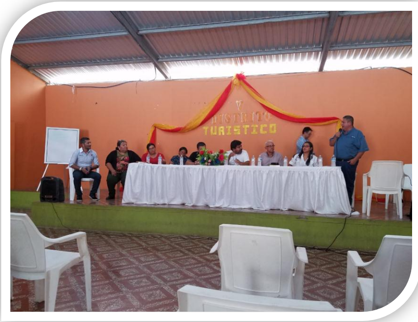
Reunión distrito turístico