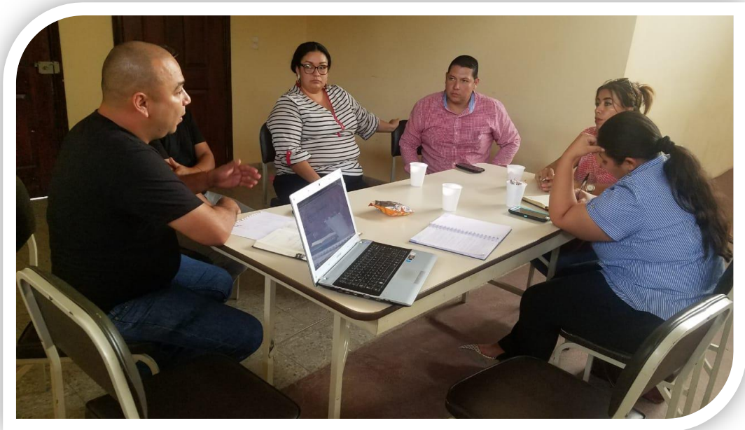
Festival de las sopas paceñas