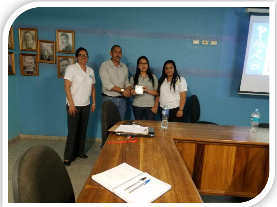
Entrega de diagnóstico turístico