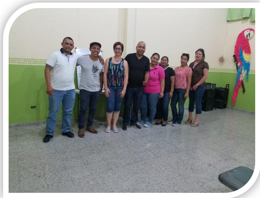
Elegida la junta directiva