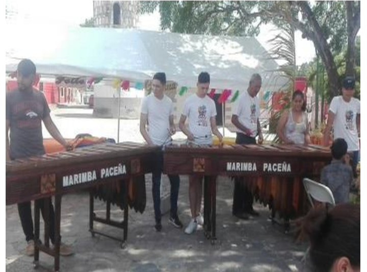
Presentación de la Marimba Municipal y Danza Folclórica en el aniversario del Instituto Dr. Lorenzo Cervantes.