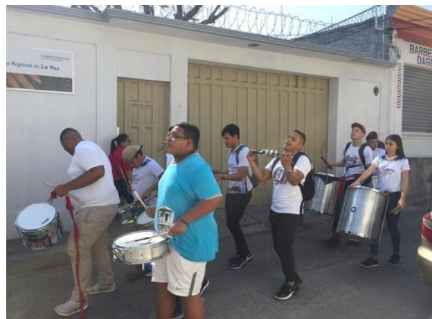
Final de Futbol Centros Básicos.