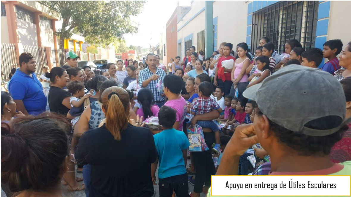
Apoyo en entrega de Útiles Escolares