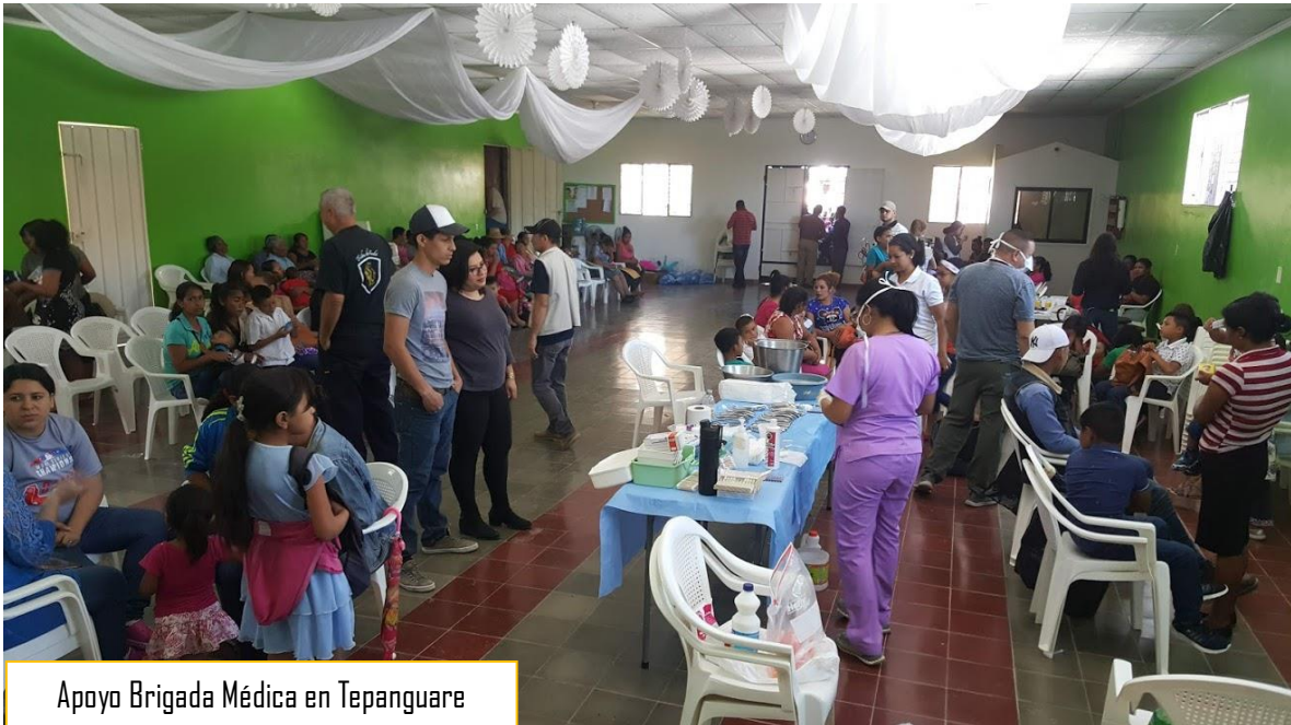
Apoyo Brigada Médica en Tepanguare