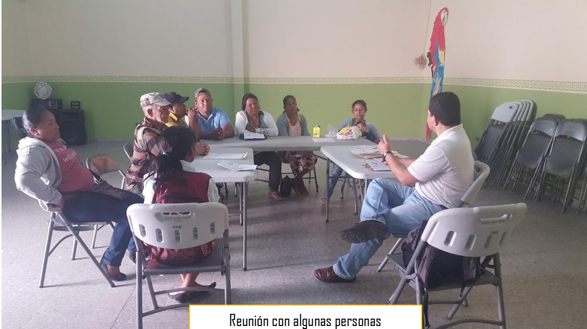
Reunión con algunas personas capacitadas con CENET