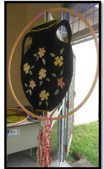
DECORACION DE ESCENARIO