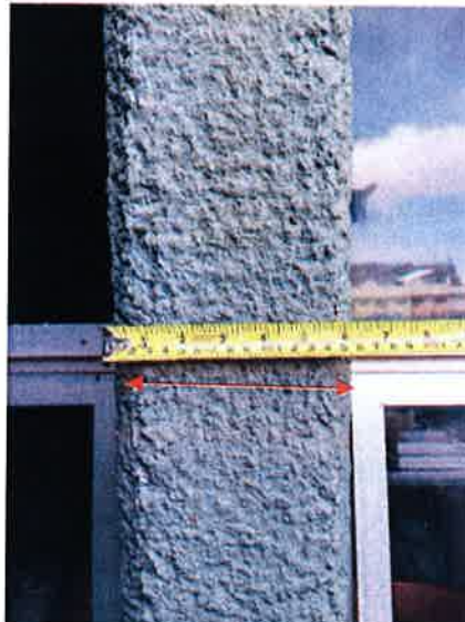
Fotografía No. 1

R. Se confirma que la dimensión es de 15 centímetros en el ancho de las columnas de concreto en fachadas del Bloque Médico Quirúrgico BMQ. Ver fotografía No. 1.