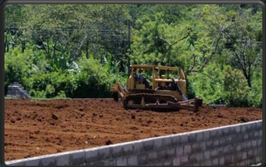
Conformación de cancha