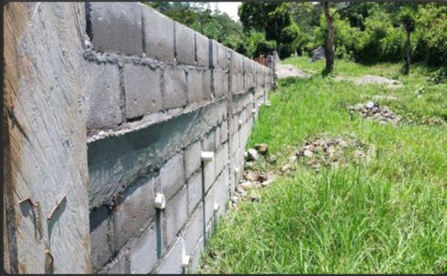
Construcción de cerco