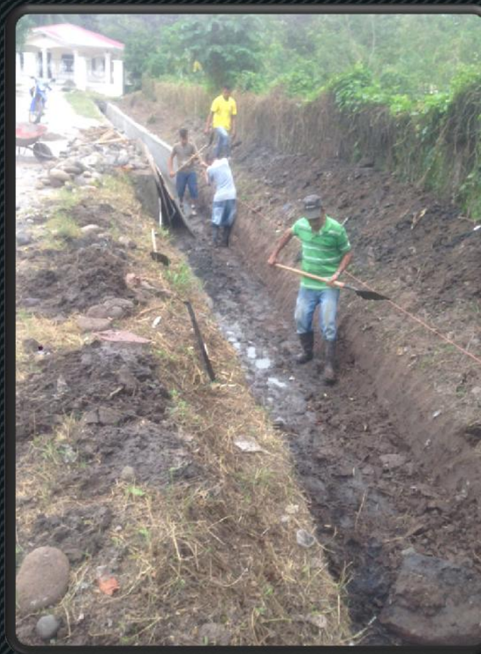
Construcción de canal, El llano