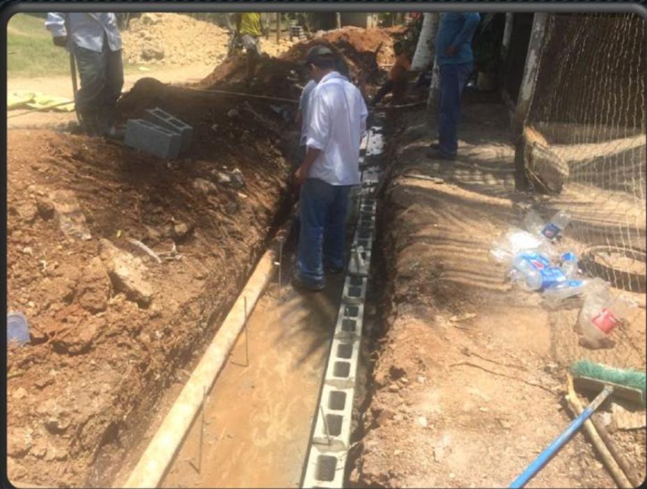
Construcción de canal, El zapote