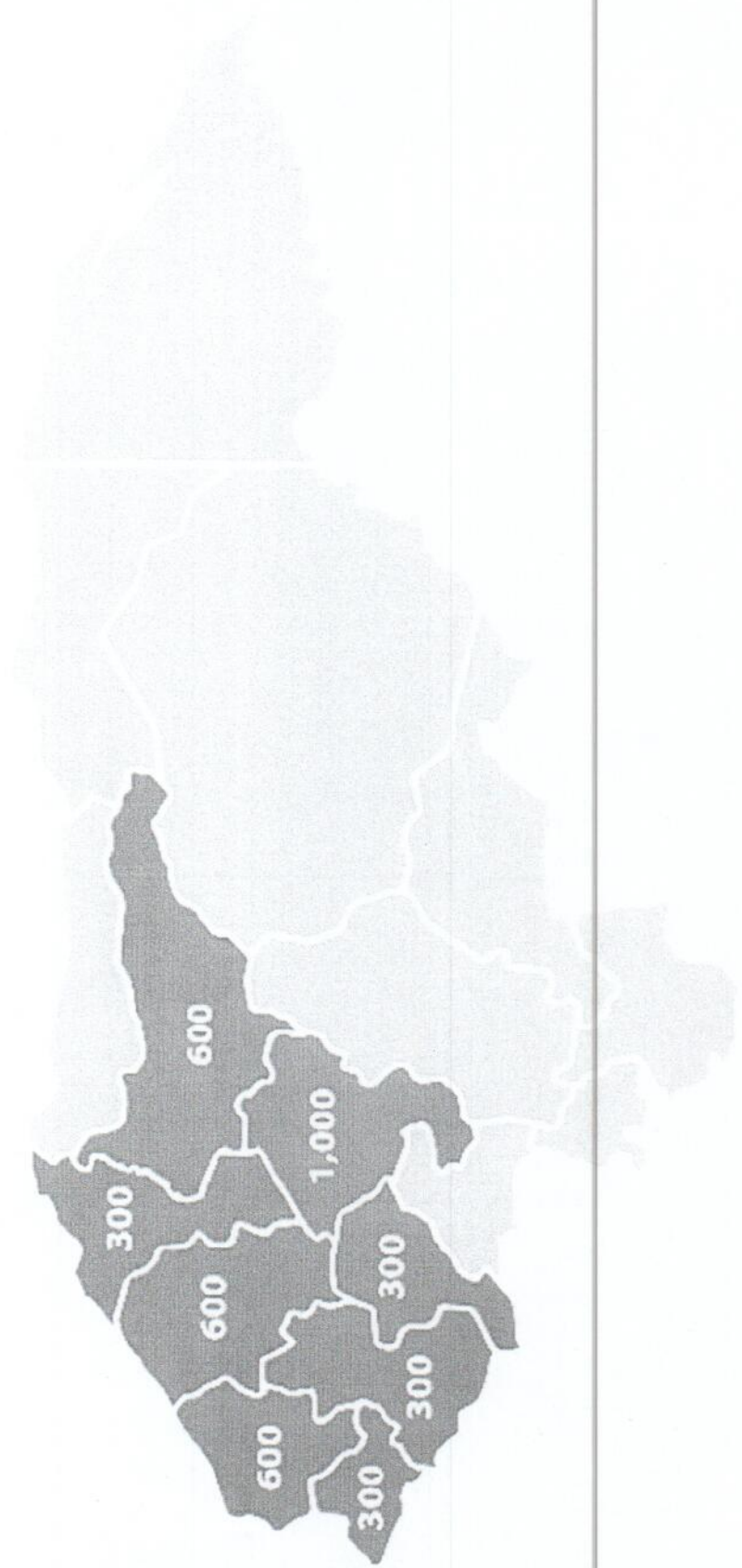
Anexo 2. Área de influencia del convenio con número de fincas a atender.

INSTITUTO NACIONAL DE PROMOCIÓN Y DEFENSA DEL ORIGEN GEOGRÁFICO PROTEGIDO