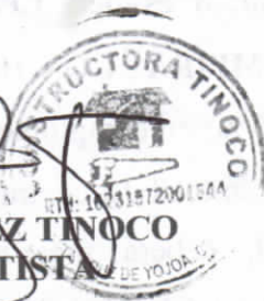
SAMUEL RAMIREZ TINOCO CONTRATISTA DE YOJOA