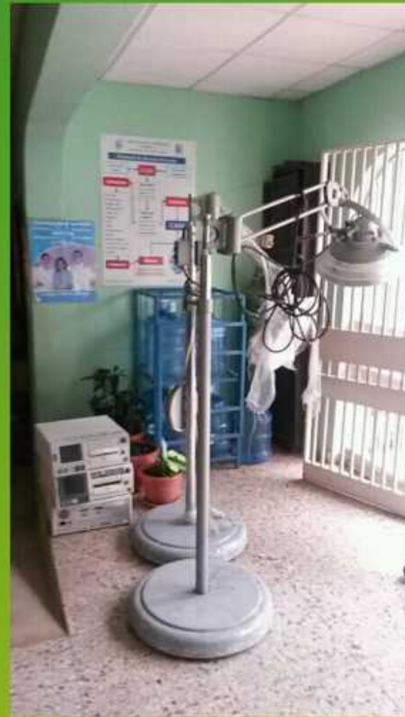
Salud y ambiente