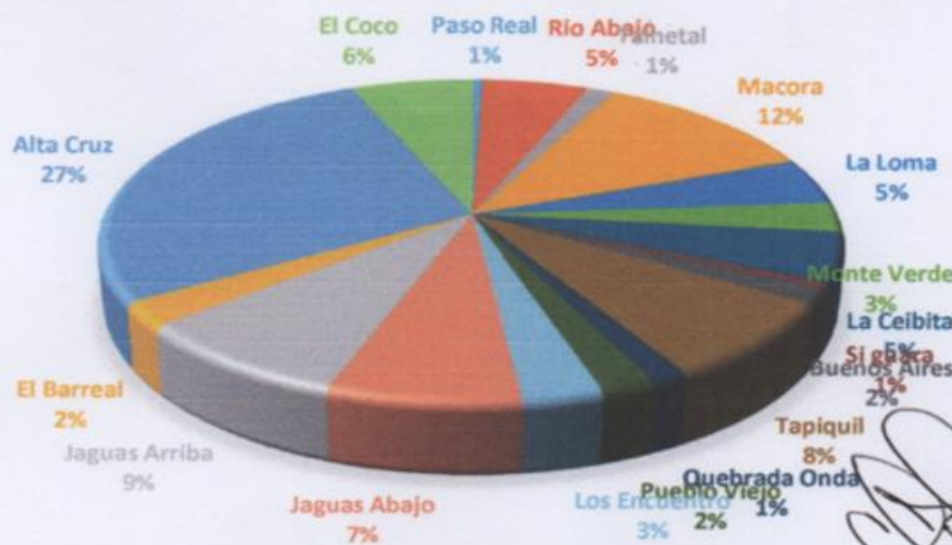
Grafico comparativo de viviendas de aldeas y caserios