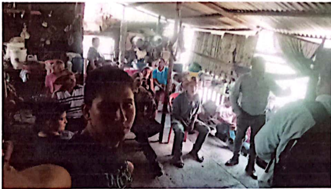
Reunión con agricultores de la comunidad el Obrajito.