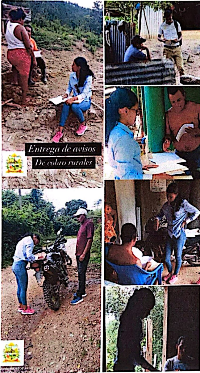
Entrega de avisos De cobro rurales