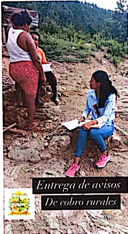
Entrega de avisos De cobro rurales