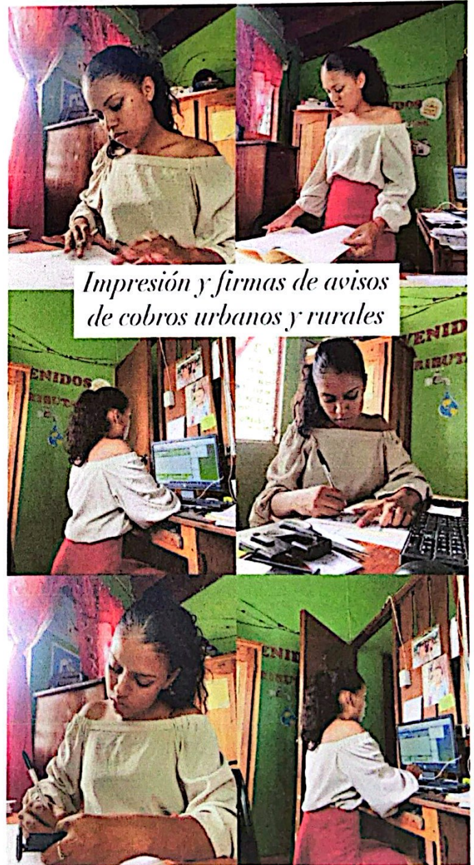
Impresión y firmas de avisos de cobros urbanos y rurales