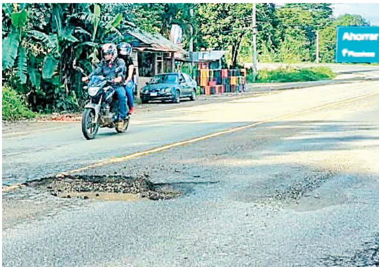
Los baches representan un peligro para los conductores.

El edil sugiere una solución concreta: concesionar las carreteras al sector privado.