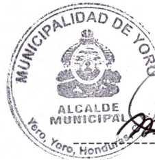
MARTHA MICAELA PUENTES GARCÍA ALCALDE DEL MUNICIPIO DE YORO, YORO