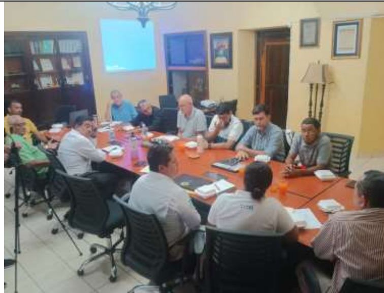
Reunión para presentación de SERSO como comanejador del RVSLD