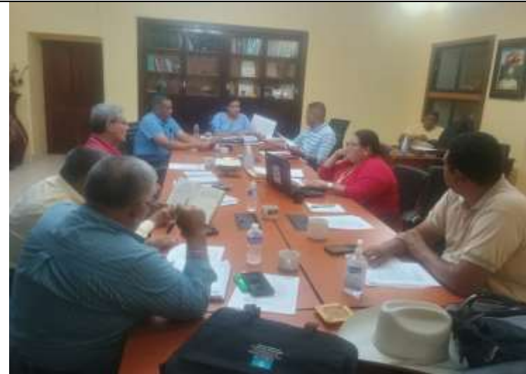
Reunión con Gerente municipal, CDM, DMA, Ecologic, Transparencia y Servicios Públicos para planificar ejecución de tareas.