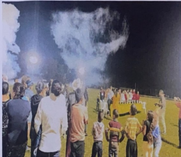
Inauguración Campo de Futbol