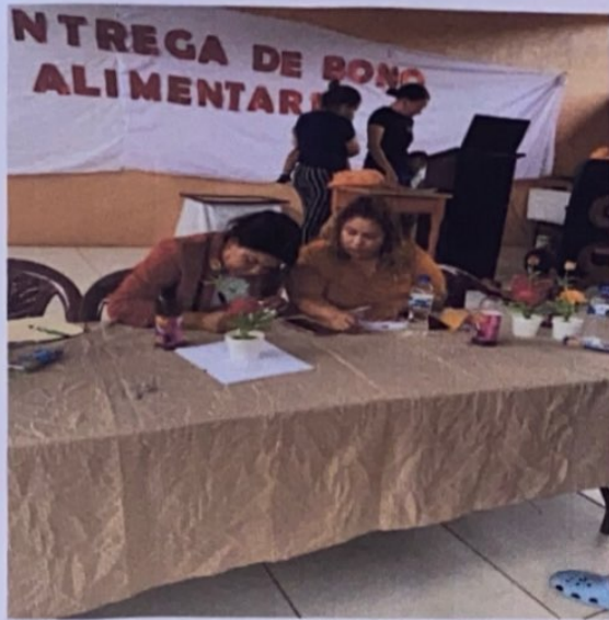
Entrega de bono alimenticio