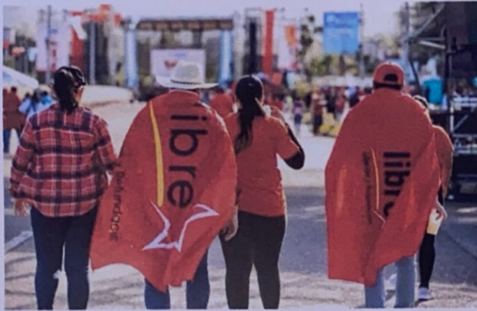
Acompañamiento a la presidenta Xiomara Castro