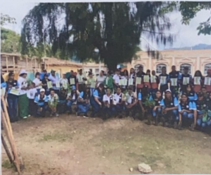
Campaña de limpieza en el casco urbano de Guayape Olancho.