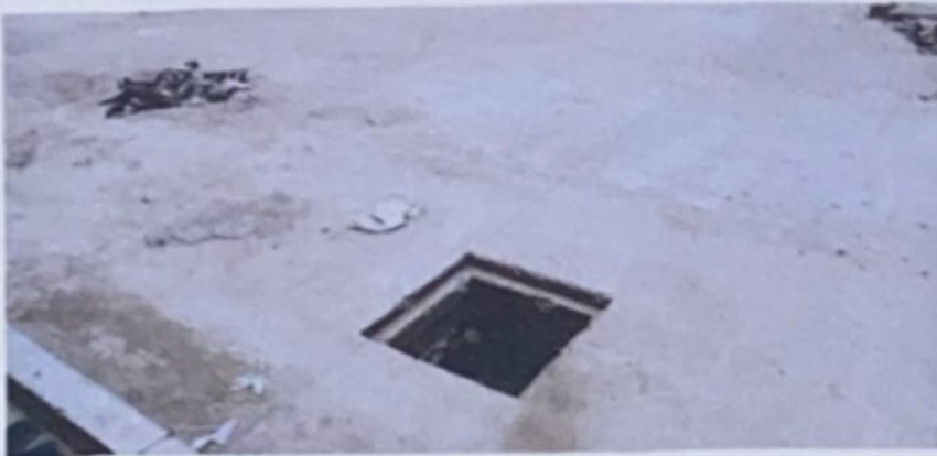
Revisión de las cajas de las aguas negras, Guayape Olancho.