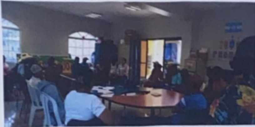
Reunión con el comité Inter Sectorial del Municipio de Guayape Olancho.