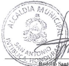
Rodolfo Santos Mendoza Alcalde Municipal