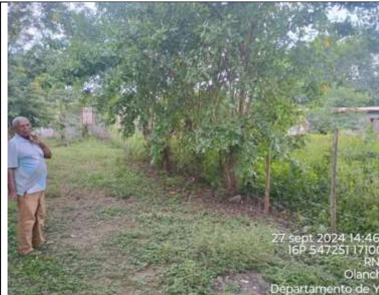
Inspección de árboles obstáculo para construcción de cerco perimetral escuela de Las Jaguas Abajo

Anexo 1: Fotografías de algunas de las Actividades realizadas durante el período