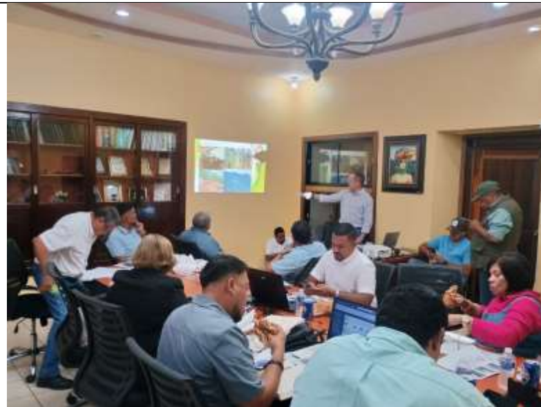
Presentación de Plan de Protección Forestal y Problemática ambiental en la sub-cuenca Uchapa Pimienta por parte del DMA ante la corporación Municipal y el CDM