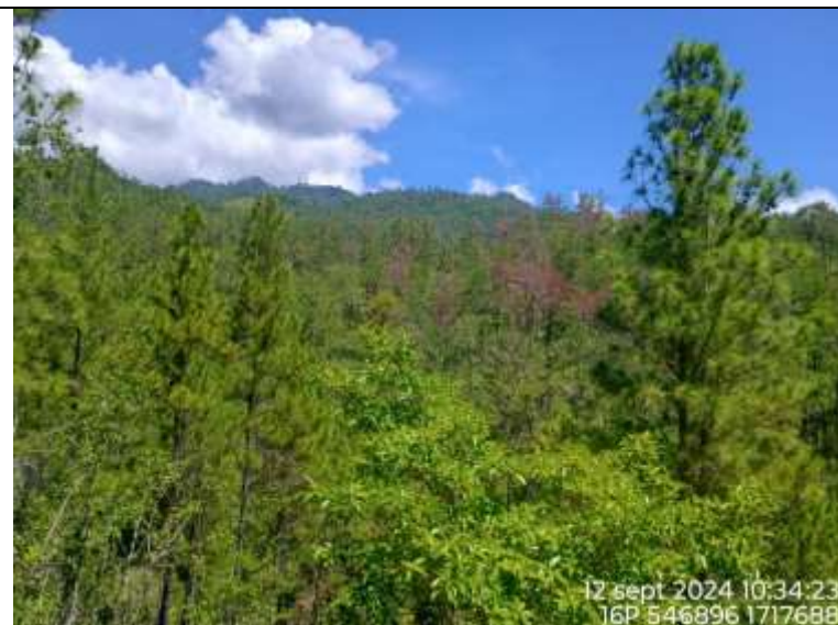
Área de Pino plagiado sitio Zapota Negro, Refugio de Vida Silvestre La Danta