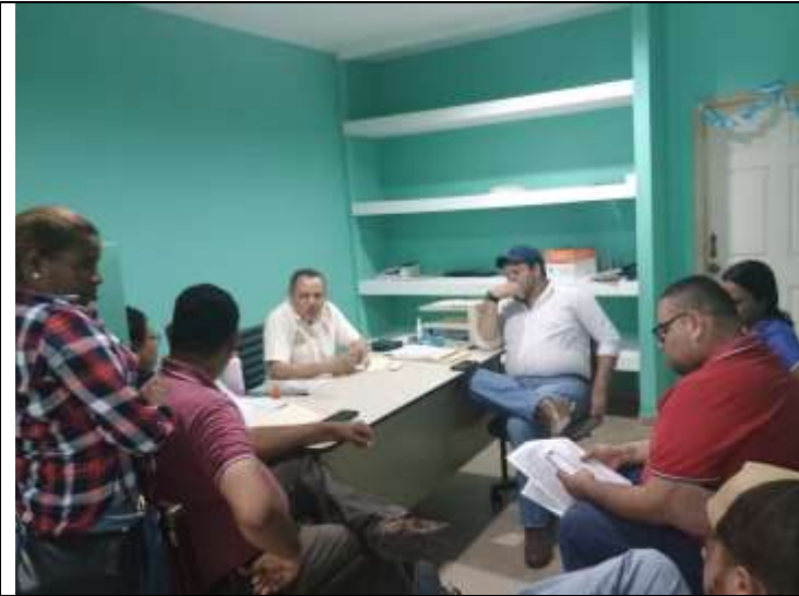
Reunión de la comunidad Tecnicos-Juridicas DMA