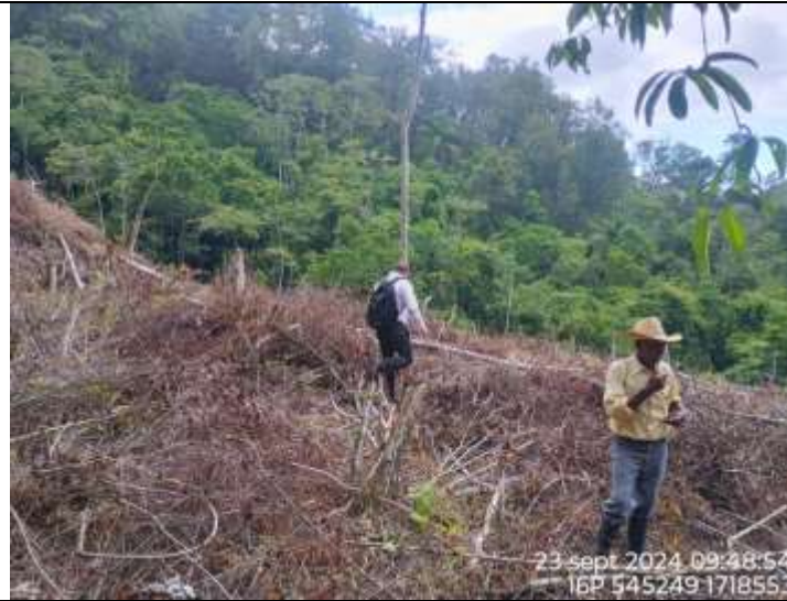
Inspección de descombro en Zona Núcleo del Refugio de Vida Silvestre La Danta