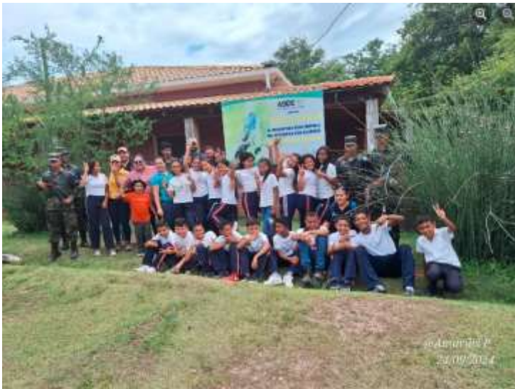
Estudiantes del Centro Básico Intercultural Dionisio Romero Narváez de la comunidad de Sabanetas, realizaron gira educativa al Centro de visitantes del Área Protegida Refugio de Vida Silvestre Colibrí Esmeralda Hondureño.