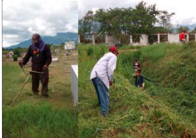
Personal del Departamento de Áreas Verdes, realiza el mantenimiento del Cementerio Nuevo Municipal