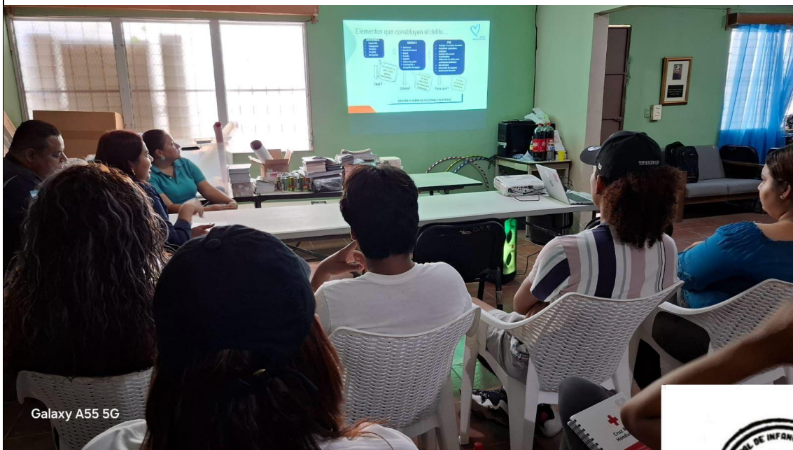
Galaxy A55 5G