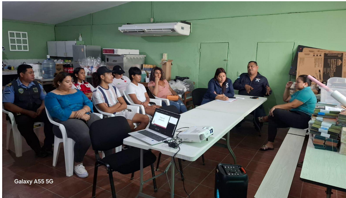
Galaxy A55 5G