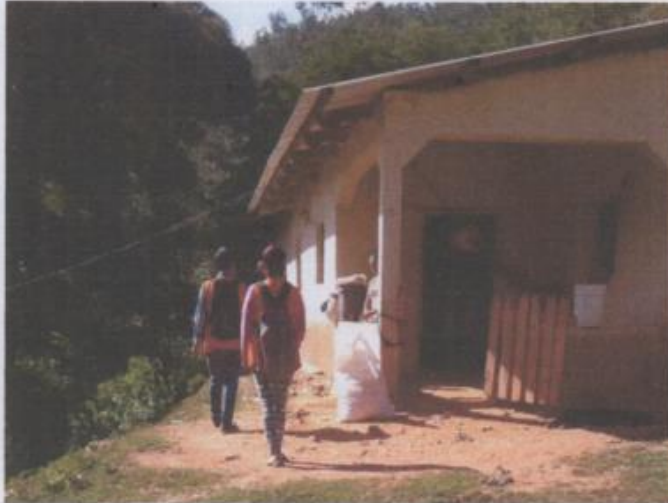
Medición de terreno en el caserillo de Buena Vista