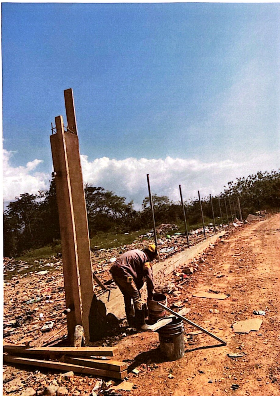
Cerca perimetral del relleno sanitario de el Municipio de el Paraiso Copan