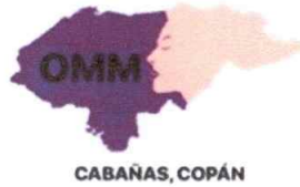
Apoyo a mujeres emprendedoras en feria del agricultor