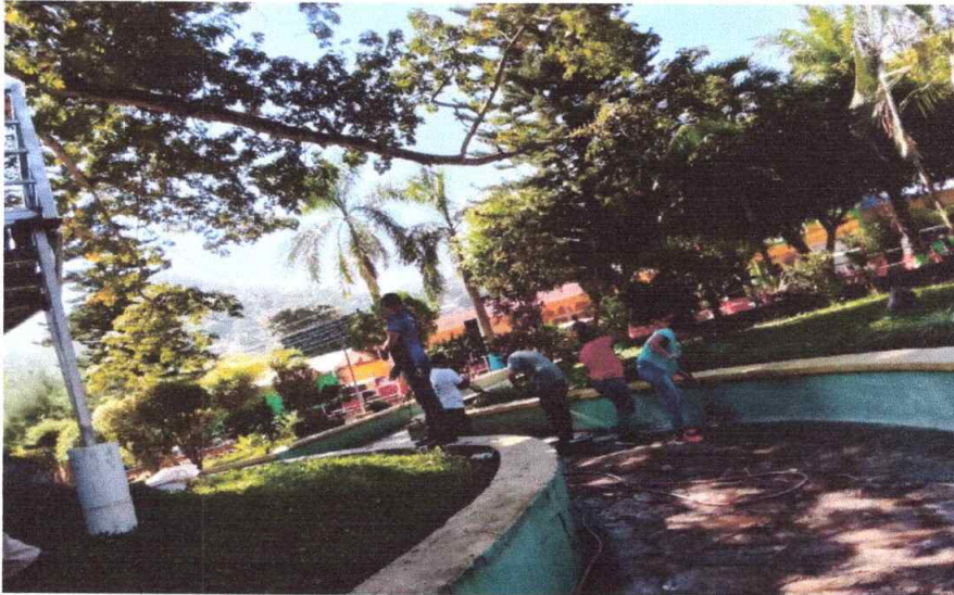
Trabajo de campo