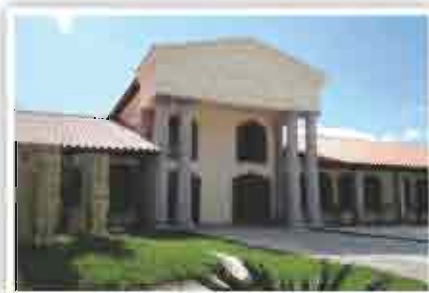
Campus Santa Rosa de Copán