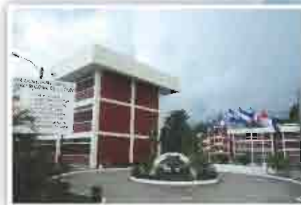
Campus La Ceiba