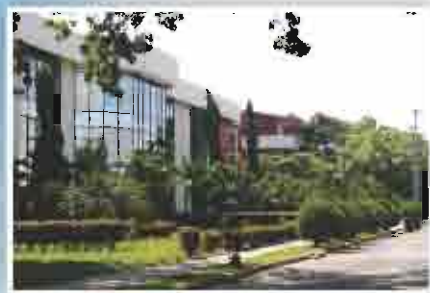
Campus San Pedro Sula