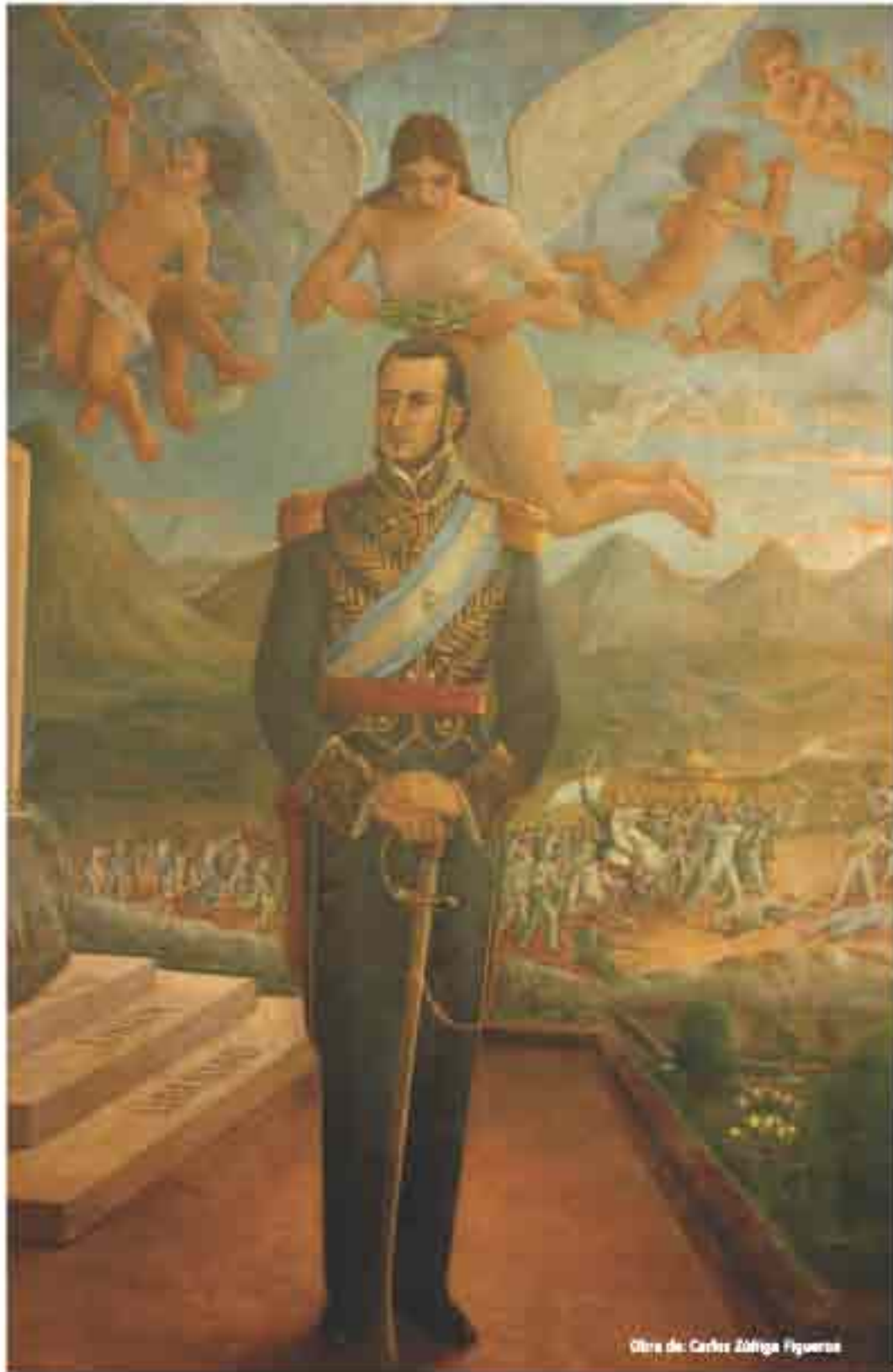
Obra de Carlos Zúñiga Figueras