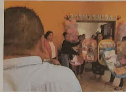
Capacitación a red de mujeres.