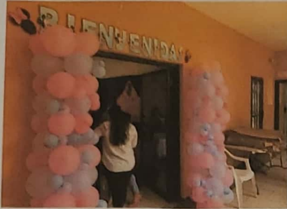
Entrega de kits de bañeras