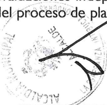
Miguel Antonio Fajardo Mejía Alcalde Municipal

También nos comprometemos a cumplir las recomendaciones y observaciones originadas de las evaluaciones independientes de la Auditoría Interna y Externa, como un insumo básico dentro del proceso de planeación, seguimiento y mejoramiento continuo de la institución.