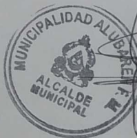
José Luis Chevez Mendoza ALCALDE MUNICIPAL

DECIMA CUARTA: JURISDICCIÓN: En todo lo no previsto en este contrato, se estará sujeto a lo dispuesto en el ordenamiento jurídico vigente. En caso de controversia EL CONTRATISTA renuncia al fuero de su domicilio y se somete expresamente al domicilio de la MUNICIPALIDAD ante el tribunal competente. En fe de lo cual y de común acuerdo, suscribimos el presente contrato en el Municipio de Alubarén, Departamento de Francisco Morazán, el día seis (06) de marzo de año dos mil veintitrés (2023).