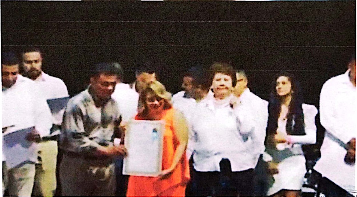
Recibiendo reconocimiento de la municipalidad de Sabanagrande francisco Morazan, por EL IAIP en puerto Cortes, Departamento De Cortes