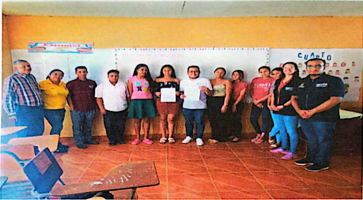
Consejo Municipal de la Juventud de Sabanagrande 31-03-2023 con el personal de Instituto de la Juventud, INJUVE, oficina de la mujer y niñez de Sabanagrande OMMN y presidente el patronato de La Cañada la Trinidad