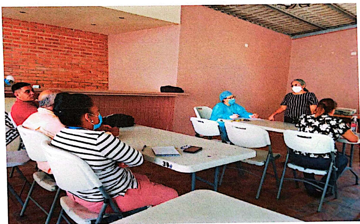
Reunión con salud pública para seguimiento plan de prevención del dengue y planificación de actividades para capacitar a jóvenes en salud sexual y reproductiva y prevención de embarazos en adolescentes