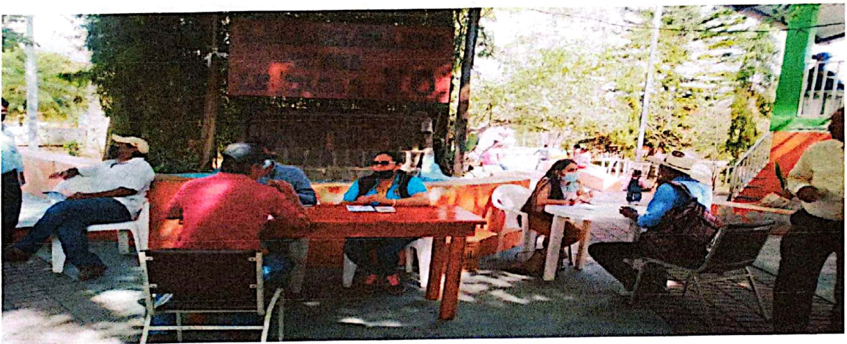
Equipo el consultorio jurídico gratuito de a UNAH , brindando asesoría legal a la población en parque Municipal