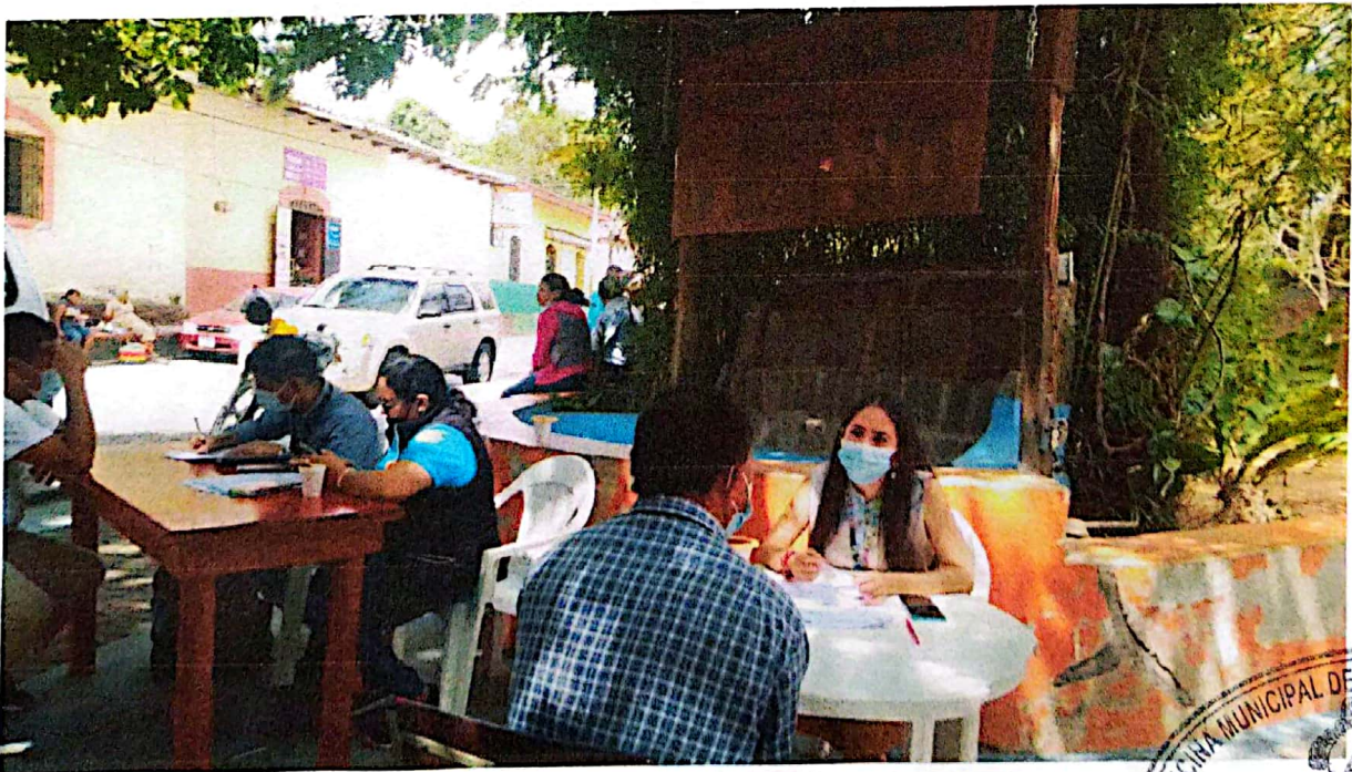
Asesoría legal a la población, a patronatos, líderes, Sabanagrande