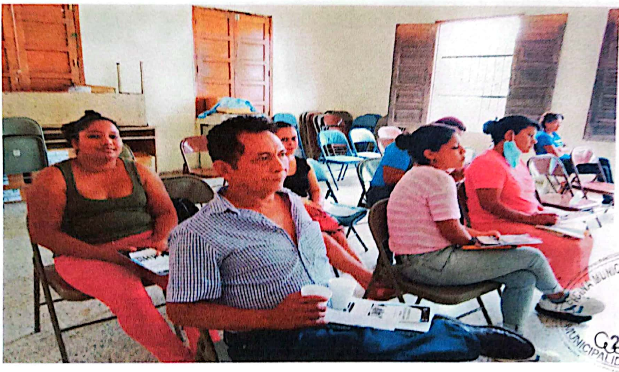
Capacitación con el CONADEH, derechos humanos, prevención de violencia género y ruta de La Denuncia Biblioteca Municipal