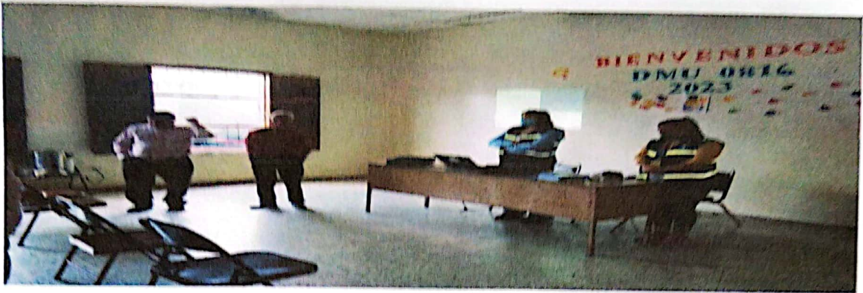
Capacitación con CONADEH