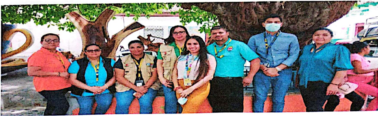
Equipo del consultorio jurídico gratuito de la UNAH., que brindo asesoría legal y capacitación a la población, patronatos y líderes comunitarios mujeres y hombres.