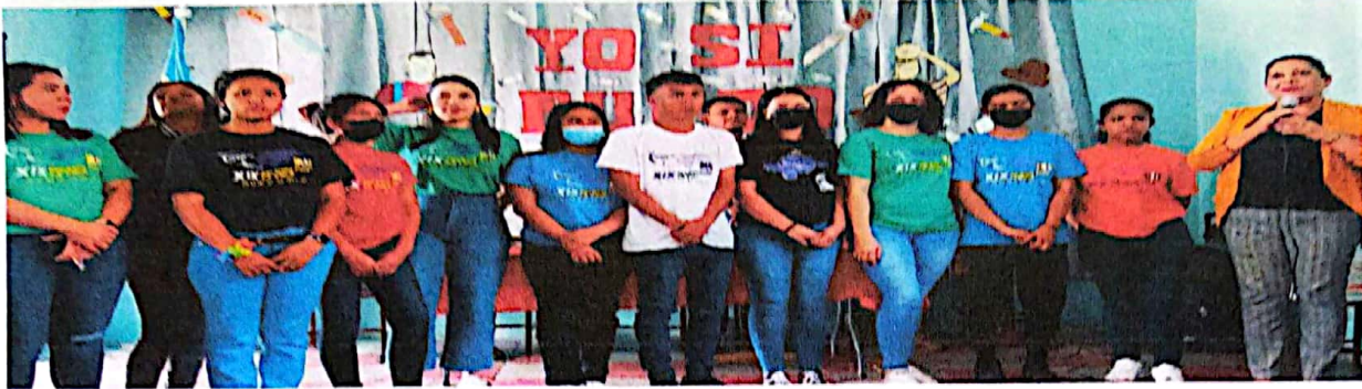
Inauguración De clases del programa de alfabetización yo sí puedo en La escuela 11 de noviembre