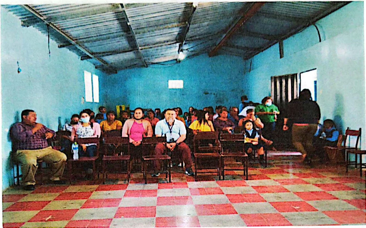
Inauguración de Clases el programa De alfabetización Yo sí puedo en la Trinidad en la escuela 11 de noviembre de la Trinidad