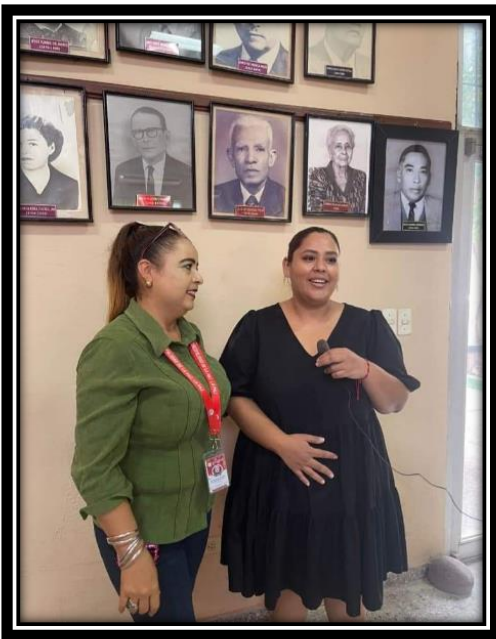
Incorporacion Galeria de Paceños