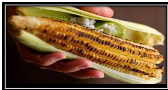
“Viernes Gastronomicos, La Paz Sabores Tradicionales”