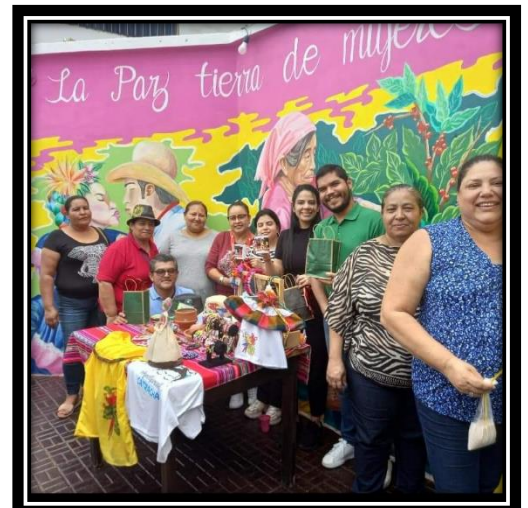
Visita del Consejo Nacional Anticorrupción.