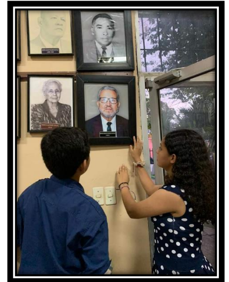
Incorporación fotográfica a la Galería de Paceños Distinguidos