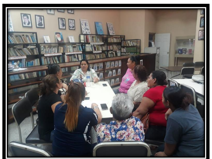
Reunión con mujeres emprendedoras.