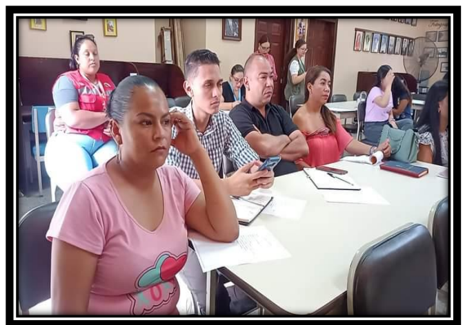
Reunión con personal técnico de ITH.