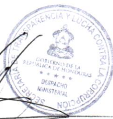
ÁNGEL EDMUNDO ORDEÑANA MERCADO Secretario de Estado en los Despachos de Transparencia y Lucha Contra La Corrupción