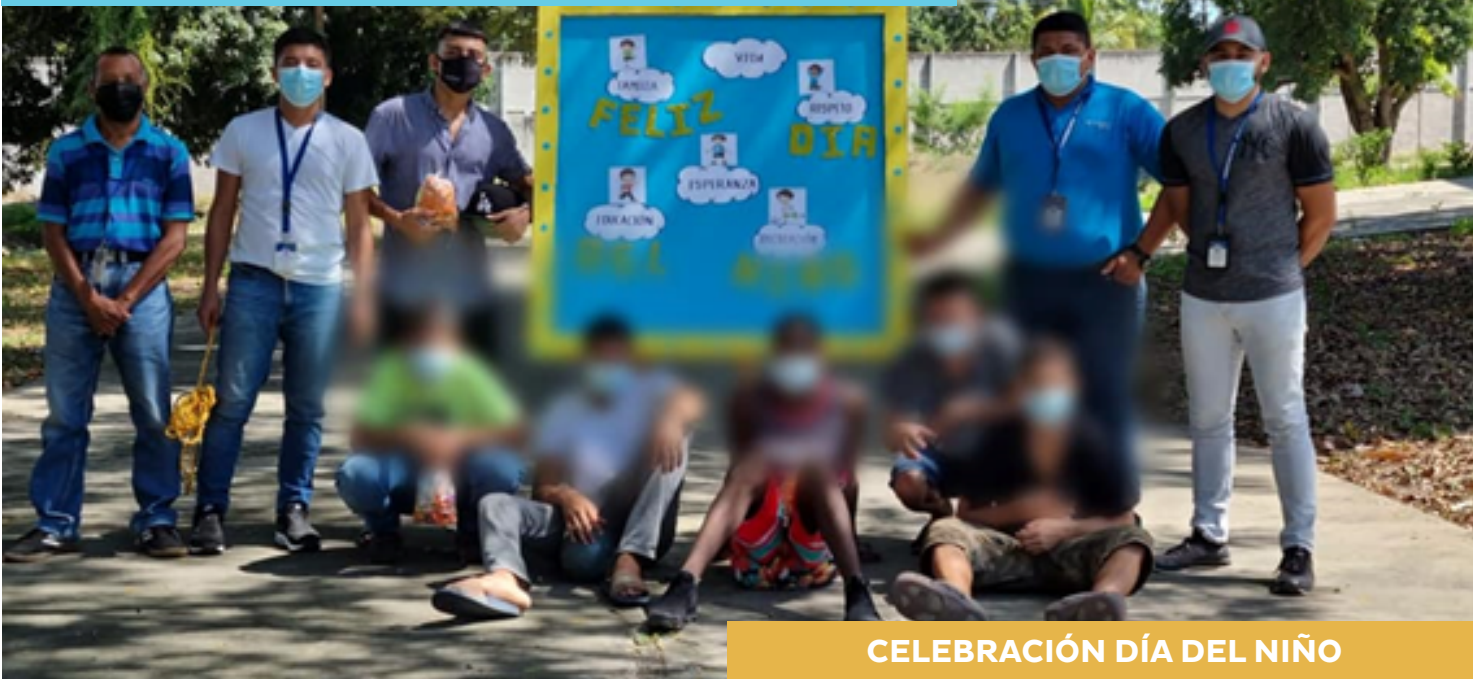
CELEBRACIÓN DÍA DEL NIÑO

En atención al derecho a la recreación que emana del Código de la Niñez y la Adolescencia en el artículo 180; 171 niños, niñas, adolescentes y jóvenes internos en los Centros Pedagógicos de Internamiento “Sagrado Corazón de María”, “Jalteva”, “Nueva Jalteva” y “El Carmen”, festejaron el Día del Niño, con una jornada recreativa, regalos y visita de padres de familia.