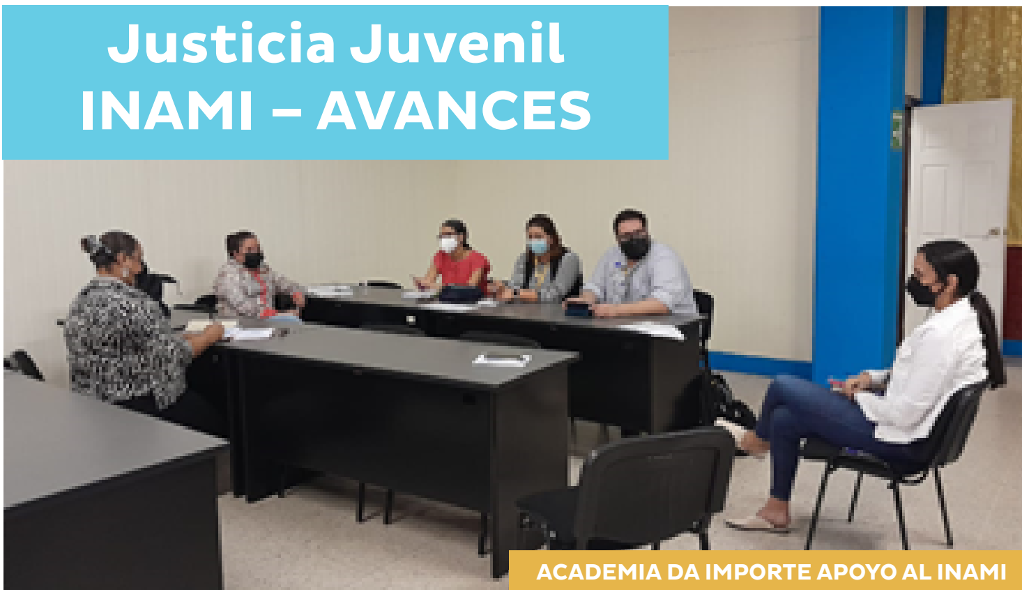
ACADEMIA DA IMPORTE APOYO AL INAMI

En fecha reciente, se realizó la segunda jornada de trabajo para la construcción de lineamientos del trabajo conjunto, entre el INAMI y la Universidad Nacional Autónoma de Honduras a través de la Dirección de Vinculación Universidad-Sociedad UNAH/DVUS.