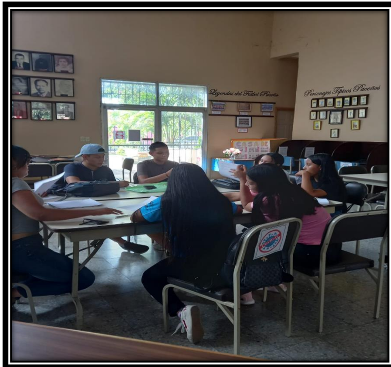
USUARIOS EN LA BIBLIOTECA