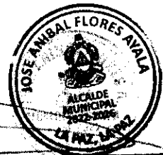
JOSE ANIBAL FLORES AYALA Alcalde Municipal La Paz