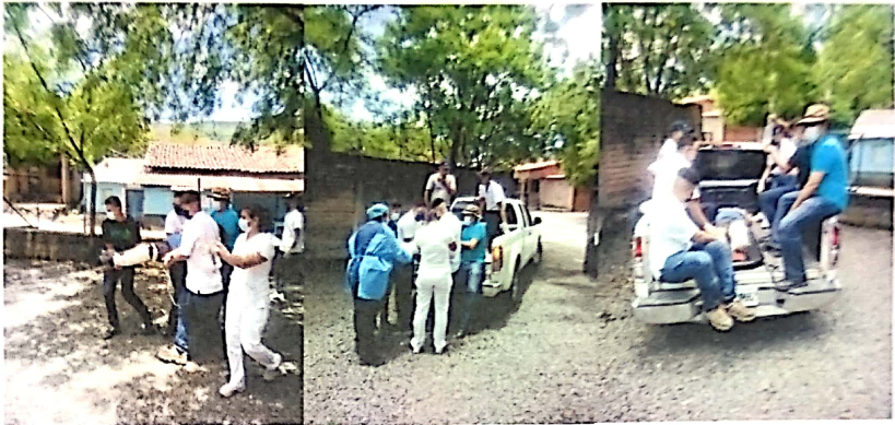
7. Acompañamiento a jefe de la UMA a retirar un arbol caido en el cementerio general de San Isidro 30/05/2022.