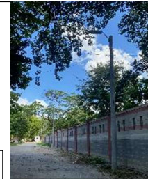
Acceso Norte y bodega de Bienes Nacionales