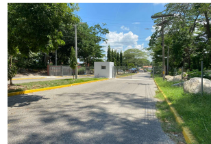
Acceso Este Principal.