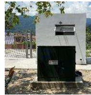
Muro, Iluminación Perimetral y Transformadores