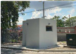
Salida Secundaria Este