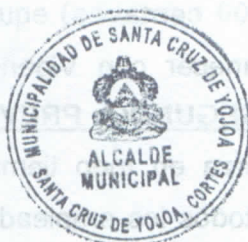
LIC. MARLON JAVIER PINEDA ALCALDE MUNICIPAL