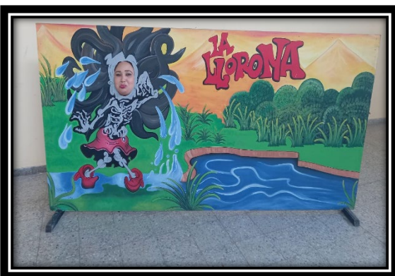
PANELES FOTOGRAFICOS DE LA TRADICION ORAL.