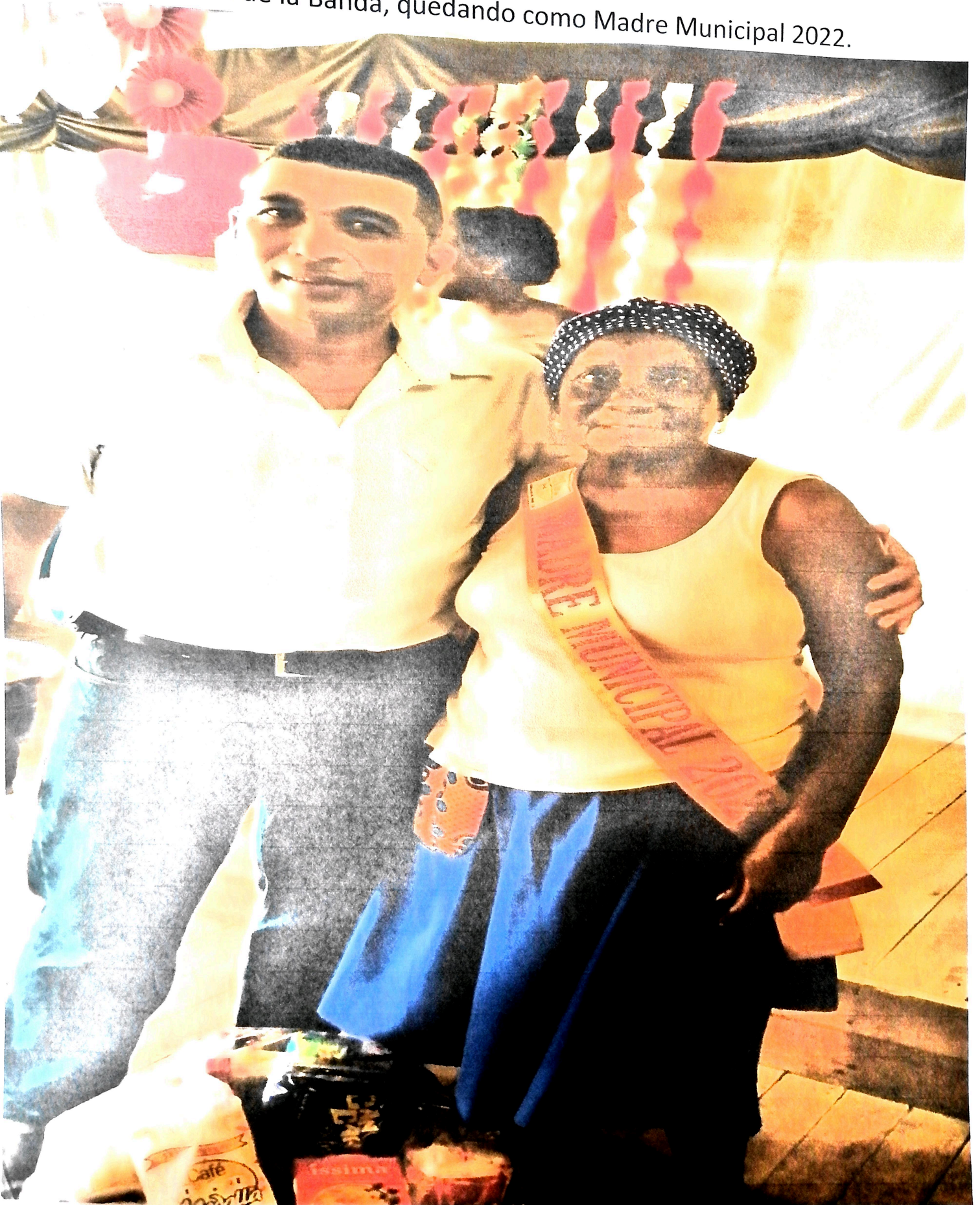
Ganadora de la Banda, quedando como Madre Municipal 2022.