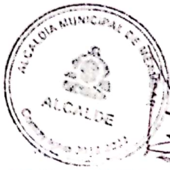
ADAN RIVERA PADILLA Alcalde Municipal

En fe de lo cual firmamos el presente contrato de prestación de servicios profesionales, en Meambar, Departamento de Comayagua, a los catorce días del mes de enero del año Dos mil veintidós.