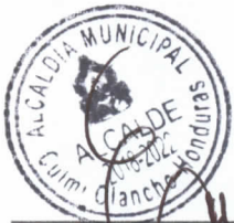
ING. EMERSON JOSUE SÁNCHEZ PÉRES ALCALDE MUNICIPAL

RESCISIÓN DEL CONTRATO. Tanto EL CONTRATANTE como EL CONTRATADO aceptan las condiciones del presente CONTRATO y establecen que el mismo podrá rescindirse por las siguientes razones: a) Por mutuo acuerdo entre las partes con el simple cruce de notas; b) Por incumplimiento de las obligaciones por cualquiera de las partes; c) Por caso fortuito o por fuerza mayor previamente comprobada, debiendo hacerse la liquidación de los pagos, anticipos y gastos entregados a la fecha en que se produzca la rescisión de EL CONTRATO sin más compromiso por parte de la municipalidad de cubrir las cantidades estimadas a la fecha; d) Por falta de desembolso del Gobierno Central a la municipalidad dejando sin ninguna responsabilidad a la municipalidad por los derivaciones de este CONTRATO. CLÁUSULA NOVENA: Todo lo no previsto en el presente CONTRATO y la falta de cumplimiento de una de las partes contratantes darán derecho a ejercitar las acciones correspondientes de conformidad a leyes de nuestro país. ACEPTACIÓN FINAL. Ambas partes, por ser verdaderas las declaraciones y modalidades que se detallan en el presente CONTRATO , se obligan a cumplir fielmente con las cláusulas derivadas del presente documento. En fe de lo cual, firmamos por triplicado el presente CONTRATO en el municipio de Dulce Nombre de Culmí, departamento de Olancho, a los dos (02) días del mes de junio del año dos mil veintiuno (2021).